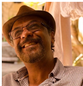
sala CUBO . FAUL

A cidade contemporânea acentua cada vez mais seu caráter heterogêneo e contraditório, sobretudo no que diz respeito às relações socio-espaciais acumuladas histórico e culturalmente. Mas é na experiência cotidiana do ser urbano, a despeito de toda carga subjetiva intrínseca à sua própria existência, que as múltiplas contradições cidadinas expõem e revelam fragmentações e colisões espaciais provocadas pelos interesses individuais e coletivos, particularmente relacionados à apropriação seletiva da terra. Essa dinâmica espacial, resultante da produção socioeconômica que estabeleceu hierarquias e controle do ser humano e dos territórios, tem orientado e definido os padrões diferenciados de consumo e habitabilidade urbana. Quanto a isso, vale ressaltar que em muitas cidades latino-americanas, asiáticas ou africanas, por exemplo, há a persistência do acentuado abismo social e da criticidade físico espacial. Esses aspetos, seus desdobramentos e consequências para a vida urbana, indicam o quanto inadequadas são essas cidades desde a sua origem, com expressivo acúmulo do deficit de moradia e infraestrutura adequada.