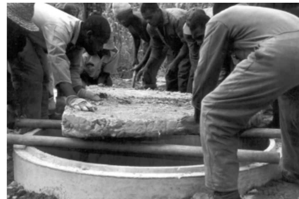
Agindo em conjunto - colocação de tampa em cacimba protegida

De forma um pouco simplista poderíamos perguntar: Com tantos problemas imediatos para resolver no nosso país não será perder tempo estarmos a discutir os problemas do mundo?