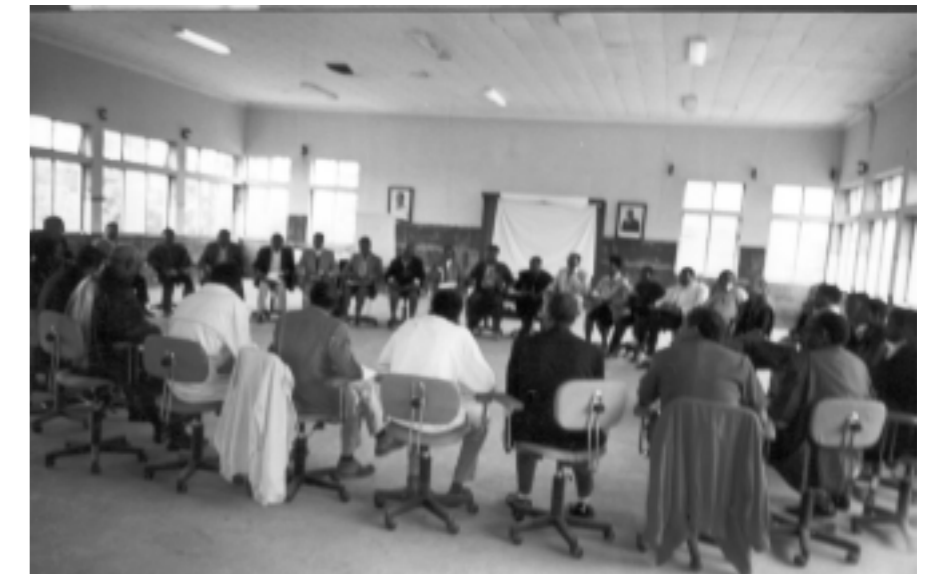
Pensando em conjunto - seminário usando métodos participativos

Ficou patente a fraca presença dos países africanos, reveladora da debilidade dos movimentos populares do nosso continente. De Angola estiveram presentes três participantes todos ligados a organizações não governamentais.