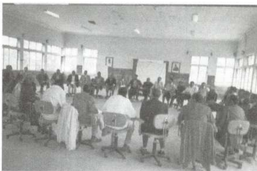
Pensando em conjunto - seminário usando métodos participativos

Ficou patente a fraca presença dos países africanos, reveladora da debilidade dos movimentos populares do nosso continente. De Angola estiveram presentes três participantes todos ligados a organizações não governamentais.